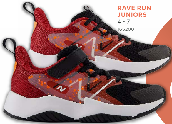
RAVE RUN JUNIORS 4 - 7 165200