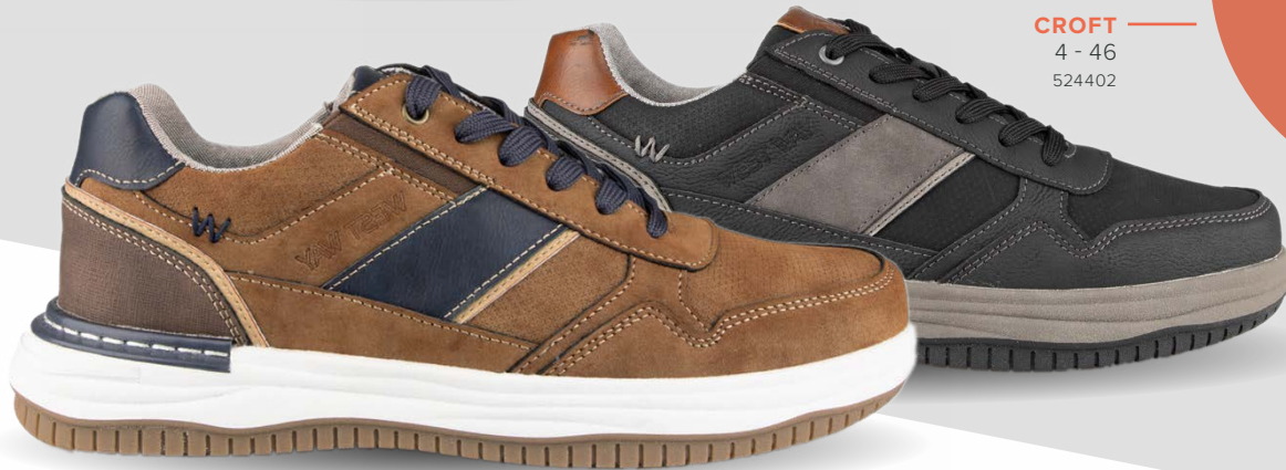
CROFT 4 - 46 524402