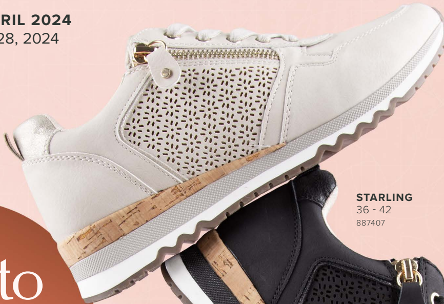
STARLING 36 - 42 887407