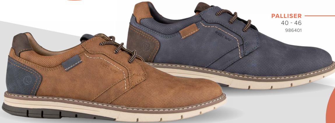
PALLISER 40 - 46 986401