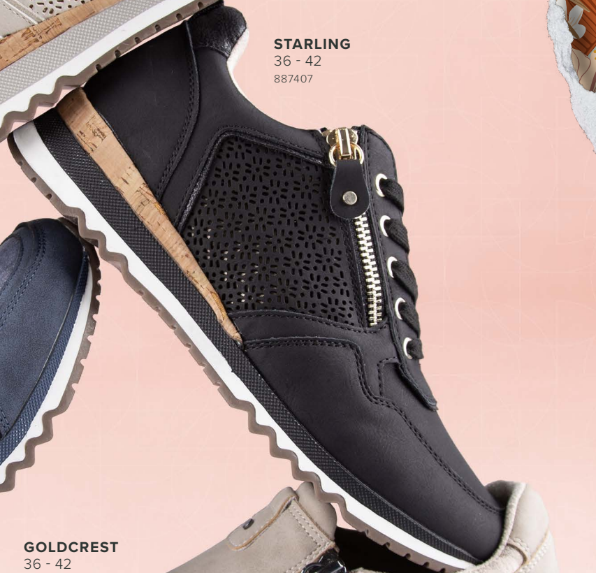
GOLDCREST 36 - 42 887406