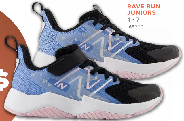
RAVE RUN JUNIORS 4 - 7 165200